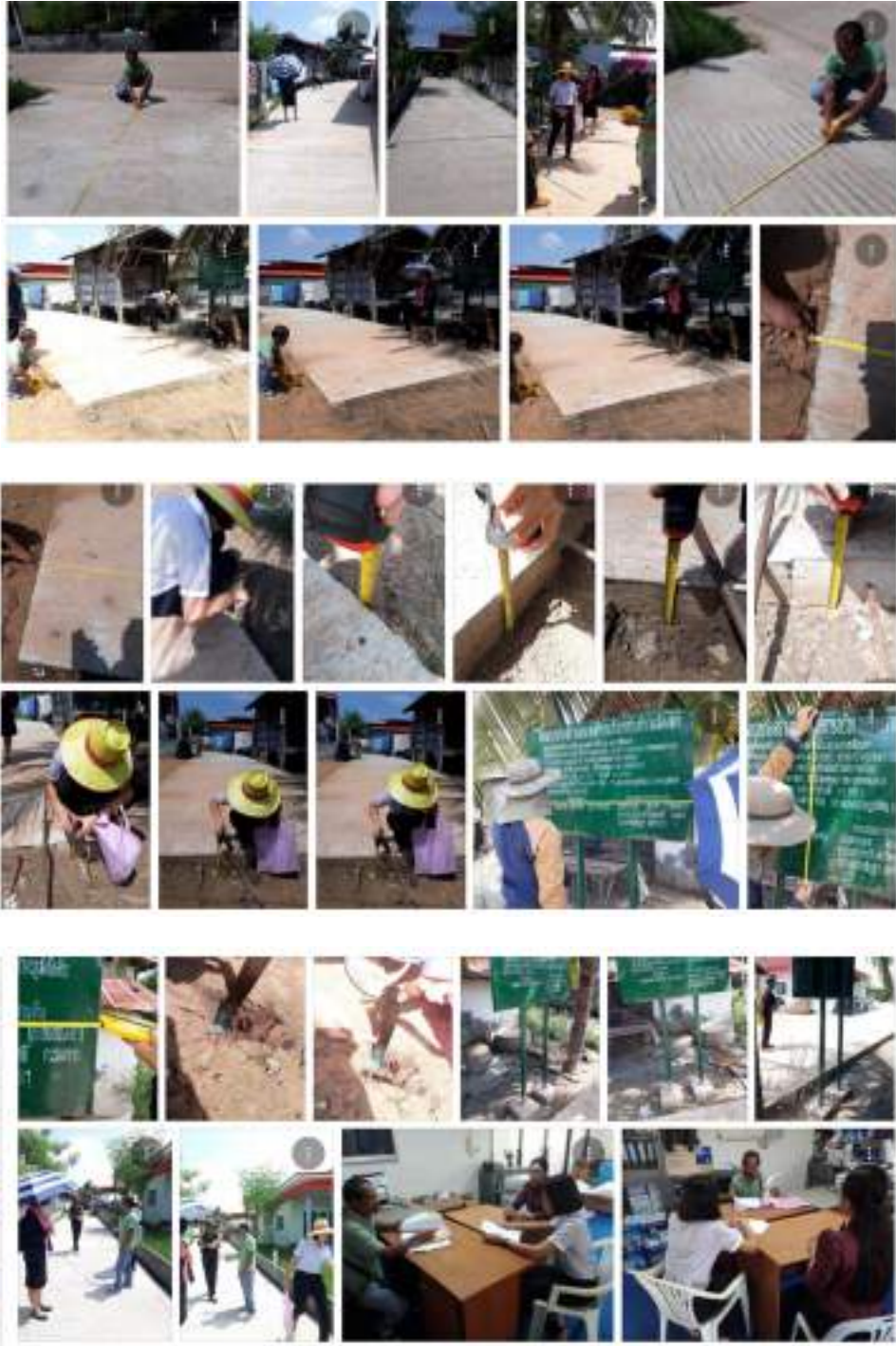
หมายเหตุ : สามารถติดตามผลการดำเนินงานองค์การบริหารส่วนตำบลเมืองเตา ประจำปีงบประมาณ พ.ศ.๒๕๖๔ ทั้งหมดได้ที่ เว็บไซต์ http://www.muangtao.go.th/