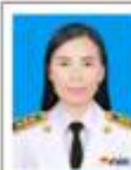
ชบ.เมือจสา