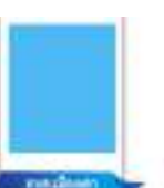
นายเมืองเตา นายกรรมาธิการ สภา อบต.เมืองเตา