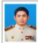
ชบ.เมือจสา