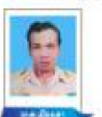
นายเมืองเตา นายกรรมาธิการ สภา อบต.เมืองเตา