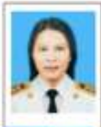
ยศ.เมือมชา