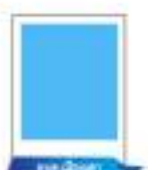
นายเมืองเตา นายกรรมาธิการ สภา อบต.เมืองเตา