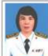
ชบ.เมือจสา