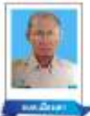
นายเมืองเตา นายก อบต.เมืองเตา ประธานสภา