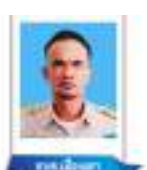
นายเมืองเตา นายกรรมาธิการ สภา อบต.เมืองเตา