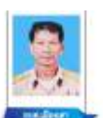
นายเมืองเตา นายกรรมาธิการ สภา อบต.เมืองเตา