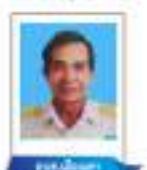
นายเมืองเตา นายกรรมาธิการ สภา อบต.เมืองเตา