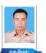
นายเมืองเตา นายกรรมาธิการ สภา อบต.เมืองเตา