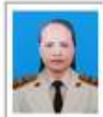
ชบ.เมือจสา