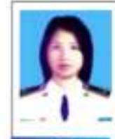
ยศ.เมือมชา