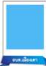
อ.บ.ต.เมืองสา