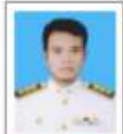
ชบ.เมือจสา