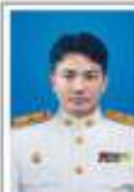
ชบ.เมือจสา